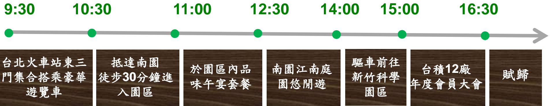
台北火車站東三門